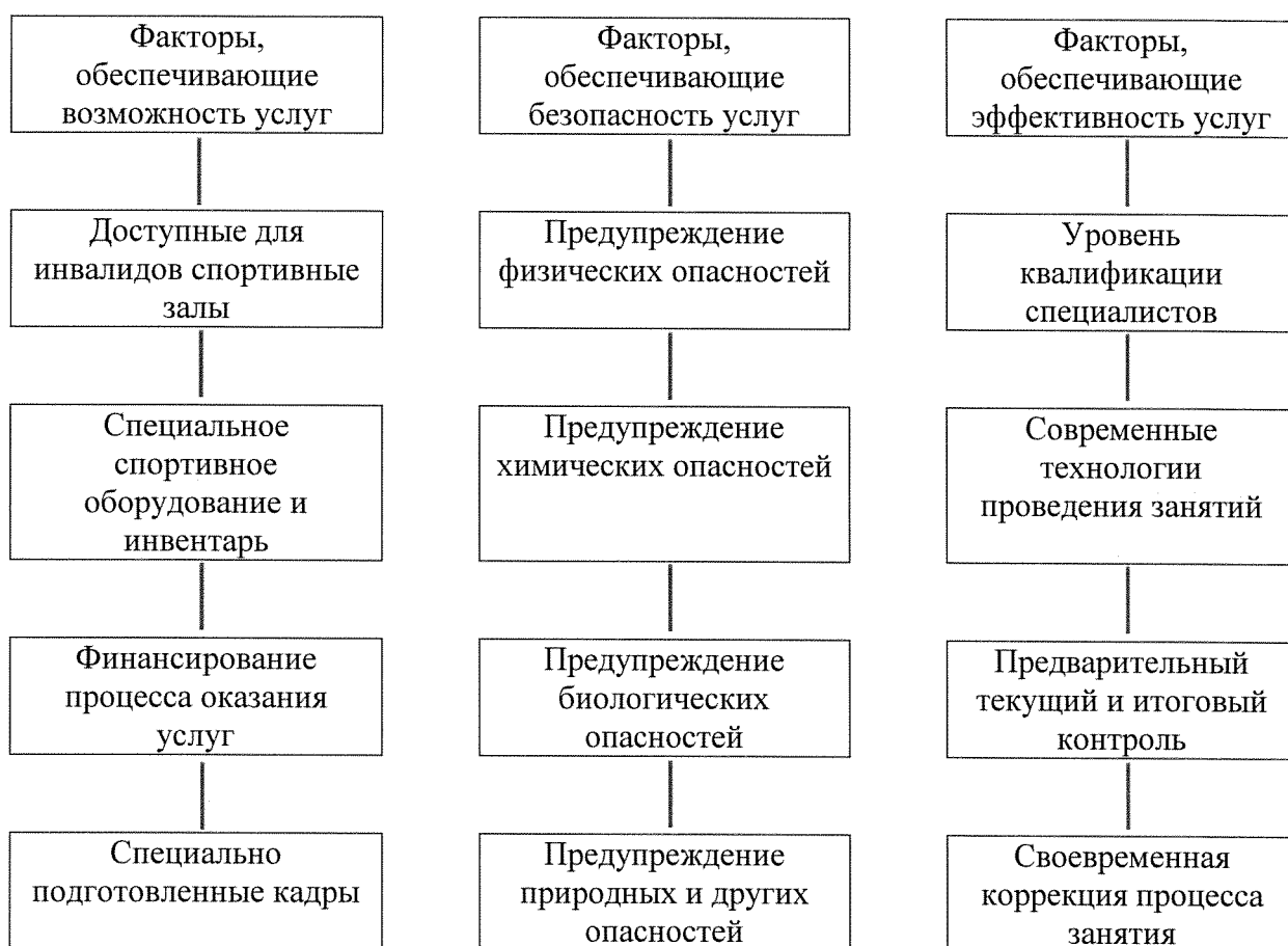
Рисунок 1. Факторы, влияющие на доступность услуг для инвалидов и других маломобильных групп населения на объектах спорта и в учреждениях и организациях, предоставляющих услуги

Понятно, что для обеспечения возможности предоставления и получения услуг для инвалидов и МГН необходимо наличие кадров, имеющих право работать с данным контингентом.